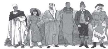
Alkitab memiliki daya tarik universal karena menyediakan jawaban jelas bagi pertanyaan-pertanyaan yang paling membingungkan dalam hidup ini

adalah ajaran ateisme) bahwa manusia dan monyet berasal dari nenek-moyang yang sama, menghina Kebenaran bahwa manusia diciptakan dalam gambar dan Tuhan Yang Mulia. Teori tidak mengakui adanya Tuhan, menolak Yesus sebagai Mesias, menolak Alkitab, dan mengolok-olok kebenaran tentang adanya rumah kekal di sorga. Setan sangat menyukai teori evolusi sebab teori