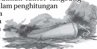
Peristiwa banjir sedunia (air bah) dalam Alkitab memberi jawaban bagi pertanyaan-pertanyaan yang tak bisa dijawab para sarjana

satu hari pada hari berikutnya setelah mereka diciptakan tapi mereka sudah dewasa. Para ilmuwan tak bisa memasukkan faktor langsung-diciptakan-dalam-keadaan-dewasa ini ke dalam penghitungan mereka. Dalam kasus-kasus seperti ini, para ilmuwan tak bisa dipercaya. Percayalah pada Alkitab, dan Anda akan selalu selangkah lebih maju dari spekulasi para sarjana dan ilmuwan.