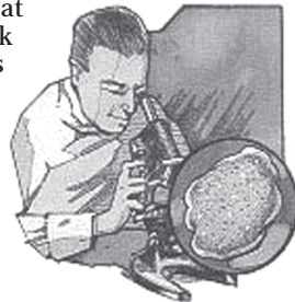
Ilmu Pengetahuan Alam yang benar selalu selaras dengan Alkitab sebab Tuhanlah pencipta keduanya.

baru-baru ini bahwa sebuah sel itu sangatlah kompleks menunjukkan fakta bahwa kemunculan kehidupan dengan cara kebetulan pada sebuah sel tunggal adalah sebuah ketidakmungkinan secara matematis.