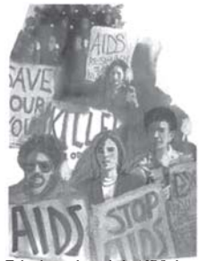
Tak akan ada wabah AIDS di dunia ini jika Hukum Tuhan tentang moralitas dipatuhi.

Perintah yang ditulis Nabi Musa di dalam Alkitab bahwa kotoran manusia harus dikubur sudah diberikan Tuhan 3500 tahun sebelum para ilmuwan menemukan prinsip kesehatan itu. Perintah itu telah mencegah kematian ribuan orang-orang Israel dan Yahudi. Masalah-masalah besar di zaman sekarang akan terus ada apabila sanitasi (kebersihan lingkungan) tidak ditangani dengan tepat.