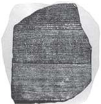
Artefak-artefak kuno yang digali para ahli arkeologi berulang kali mengukuhkan ketepatan dan kebenaran Alkitab.