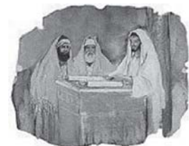
Yesus mengutip Alkitab dan menyatakan bahwa Alkitab adalah kebenaran.

Yesus berkata, “Ada tertulis: Manusia hidup bukan dari roti saja, tetapi dari setiap firman yang keluar dari mulut Allah.” “Ada pula tertulis: Janganlah engkau mencobai Tuhan, Allahmu!” “Sebab ada tertulis: Engkau harus menyembah Tuhan, Allahmu, dan hanya kepada Dia sajalah engkau berbakti!” (Matius 4:4, 7, 10). Firman-Mu adalah kebenaran.” (Yohanes 17:17).