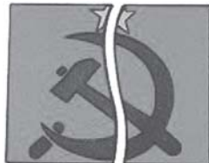
Waktu komunisme Uni Soviet runtuh, para mantan penganutnya mencari Alkitab sebagai satu-satunya harapan bagi rakyat bekas negara Uni Soviet itu

Catatan: Bekas negara Uni Soviet telah mencoba paham komunisme, ateisme, dan juga teori evolusi, yang merupakan prinsip utama pandangan hidup Marxisme. Semuanya telah gagal. Negara-negara republik pecahan Uni Soviet menyadari bahwa hanya ada satu jalan bagi mereka, dan mereka hampir serempak menjerit mencari Kebenaran: "Berikan pada kami Alkitab dan ajaran kekristenan. Sekarang kami harus berdiri di atas dasar doa dan iman Kristen yang tak tergoyahkan. Tak ada yang lebih baik dari Alkitab. Tak ada tulisan-tulisan manusia lainnya yang bisa menjawab pertanyaan-pertanyaan besar dalam hidup ini dan membawa kedamaian bagi bangsa-kami. Jangan biarkan kami menunggu! Kami sangat membutuhkan Alkitab, Tuhan dan kekristenan sekarang juga." Sekali lagi, Buku Tuhan menang.