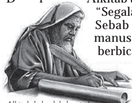
Alkitab bukanlah kumpulan ide-ide manusia semata. Para penulisnya diilhami oleh Roh Kudus

“Segala tulisan yang di ilhamkan...” (2 Timotius 3:16) Sebab tidak pernah dibuat dihasilkan oleh kehendak manusia, tetapi oleh dorongan Roh Kudus orang-orang berbicara atas nama Tuhan.” (2 Petrus 1:21) “Kitab Suci tidak dapat dibatalkan...(Yohanes 10:35)